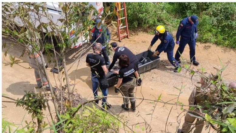
Trabalhador morre eletrocutado em Brusque

Um homem de 30 anos ainda não identificado morreu na manhã desta quinta-feira (14) enquanto trabalhava em um poste na cidade de Brusque , no Vale do Itajaí. De acordo com informações preliminares, ele teria sido eletrocutado.