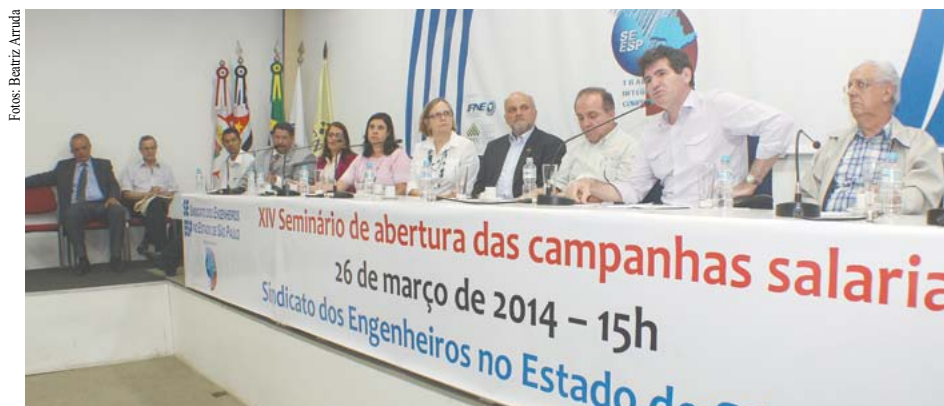
Em sua 14ª edição, seminário aponta conjuntura favorável às campanhas salariais deste ano.