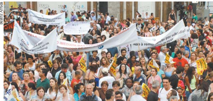
Diante do difícil processo de negociação, profissionais foram às ruas exigir remuneração justa.

Cerca de 200 servidores municipais, entre engenheiros e arquitetos, realizaram manifestação em 18 de março, no centro da Capital. Encerrando o ato em frente à Câmara dos Vereadores, eles foram recebidos por parlamentares em uma reunião do Colégio de Líderes. No ensejo, apresentaram suas reivindicações e relataram o difícil processo de negociação com a Prefeitura. Os trabalhadores estão em campanha e pleiteiam alteração da Lei Salarial (13.303/03), que