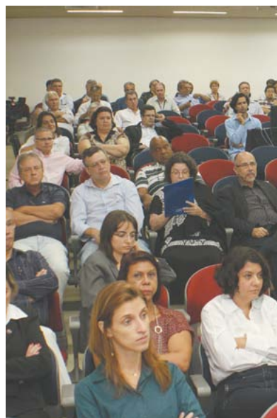
Na plateia, dirigentes sindicais que negociam com as empresas.