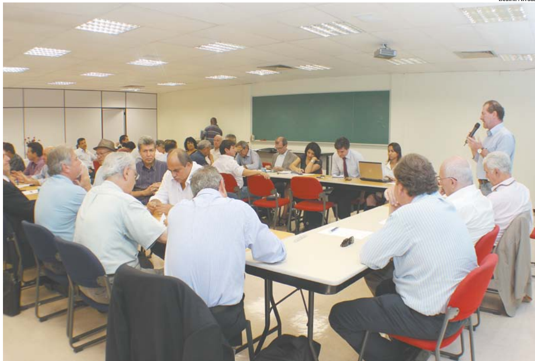
Em reunião na sede do SEESP, na Capital, consultores apresentaram à diretoria da FNE ideias ao documento.

Temas que deverão compor a próxima etapa do projeto “Cresce Brasil + Engenharia + Desenvolvimento – Novos desafios” foram apresentados à diretoria da Federação Nacional dos Engenheiros (FNE) em reunião realizada no dia 18 de março, na sede do SEESP, na Capital. Iniciativa lançada pela federação em 2006 e objeto de atualização desde então, para 2014, o “Cresce Brasil” deve focar na industrialização e na necessidade de desenvolver uma cadeia produtiva que gere riqueza e oportunidades internamente. A ser entregue aos candidatos nas eleições deste ano, o documento a ser elaborado trará propostas nesse sentido.