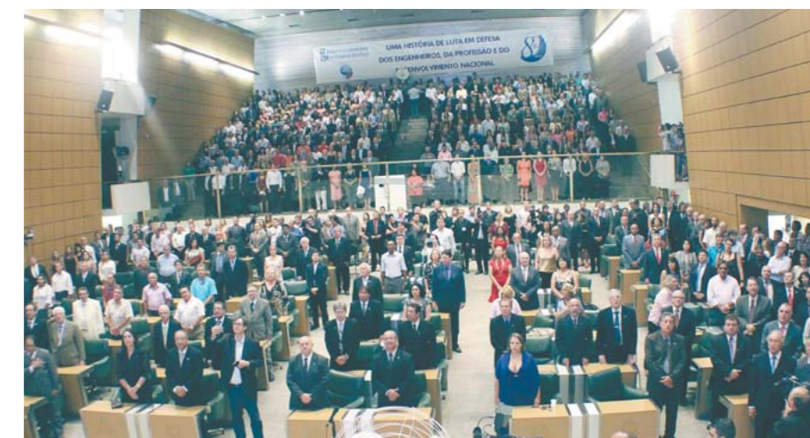
Cerca de 1.700 pessoas lotaram o Plenário Juscelino Kubitschek da Assembleia Legislativa de São Paulo, como reflexo da representatividade do sindicato e reconhecimento ao seu trabalho.

Trajetoária em prol da categoria, do Estado e do País, bem como importância da atual diretoria para avanços mereceram ênfase durante solenidade.