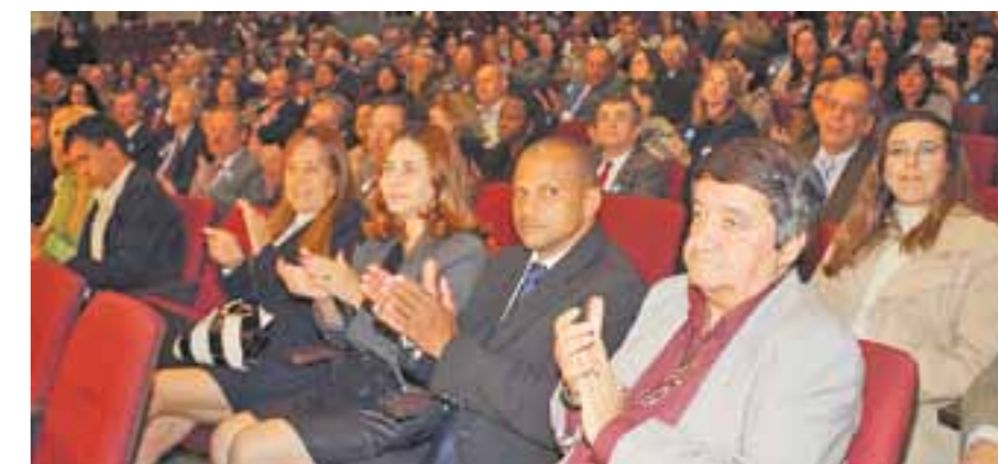
Na plateia, estudantes, profissionais e interessados em geral.