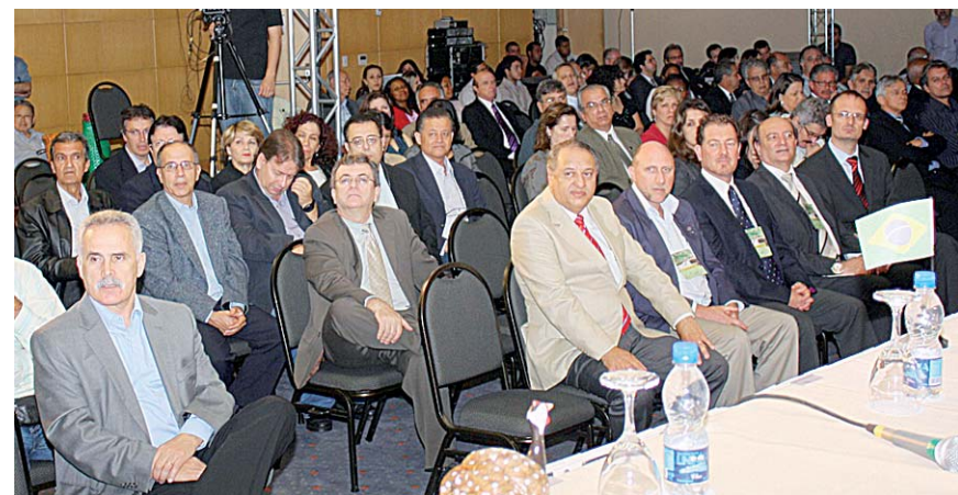
Público incluiu engenheiros e estudantes da área, cuja contribuição a um projeto sustentável é crucial.