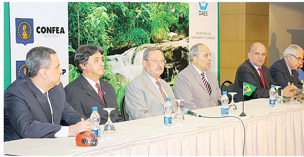
À abertura, destaque para importância de se realizar debate sobre expansão socioeconômica sem descuidar do meio ambiente.