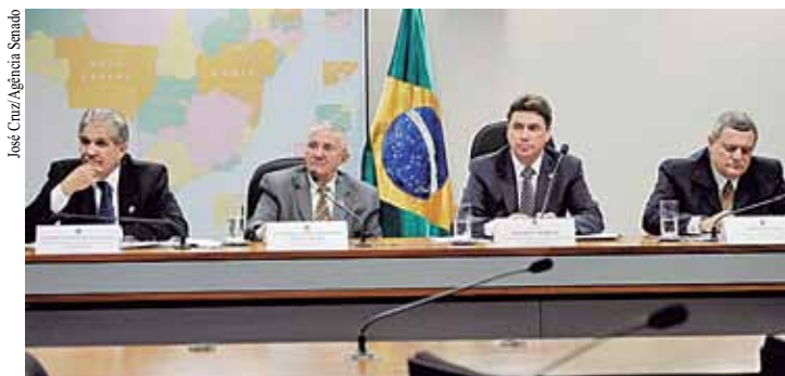
Diretor apontou necessidade de remuneração justa e qualificação para assegurar mão de obra especializada e atender demandas do desenvolvimento.