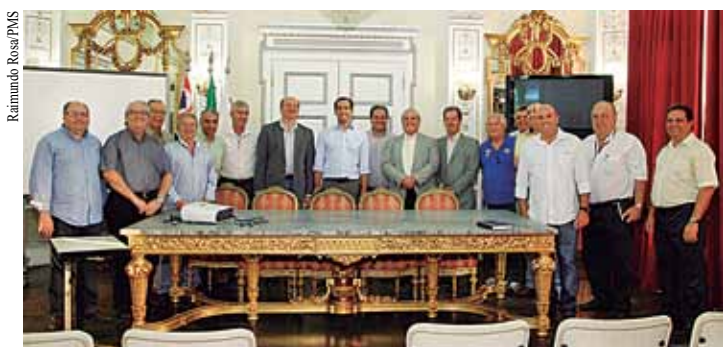
Em audiência, diretores do sindicato pedem abertura de negociação para tratar do piso e de plano de carreira dos engenheiros da Prefeitura.