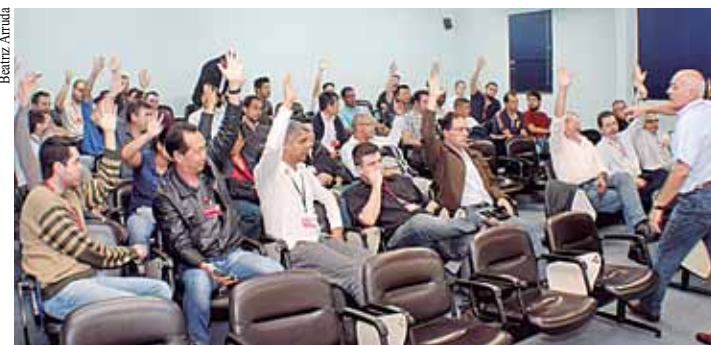
Assimilando a audiência pública, os engenheiros da CPTM aprovaram a proposta econômica, mas mantêm o estado de greve pelo cumprimento da lei relativa ao piso da categoria.

nimo de R$ 3.548,00 por empregado, vinculado ao cumprimento de metas e resultados, com pagamento em 31 de março de 2015. Não obstante, na ocasião, os engenheiros decidiram manter estado de greve até o cumprimento, pela companhia, do salário mínimo profissional (Lei 4.950-A/66).