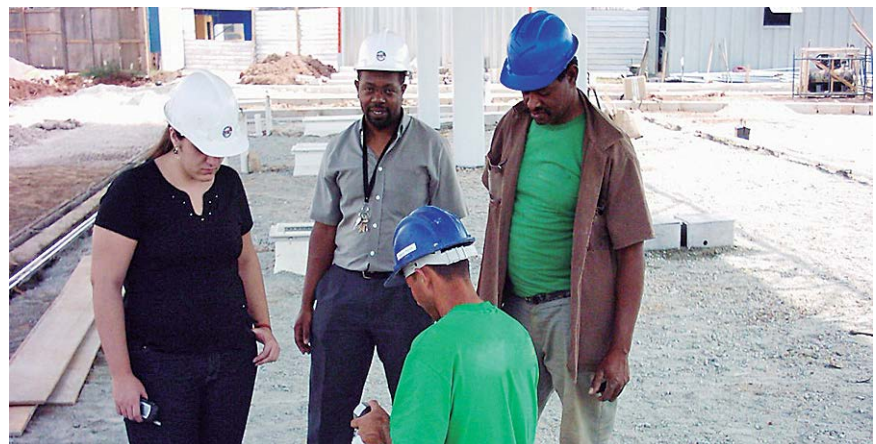
Mackey: a mulher está conquistando espaço e respeito na área.