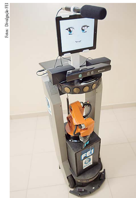
Robô Judite, feito por estudantes da FEI para competição internacional: exemplo de inteligência artificial.

Mesmo descartando os receios gerados pela IA, o professor da FEI faz companhia aos cientistas que adotam as três leis da robótica, criadas pelo escritor russo e bioquímico Isaac Asimov, na obra “Eu, robô”, de