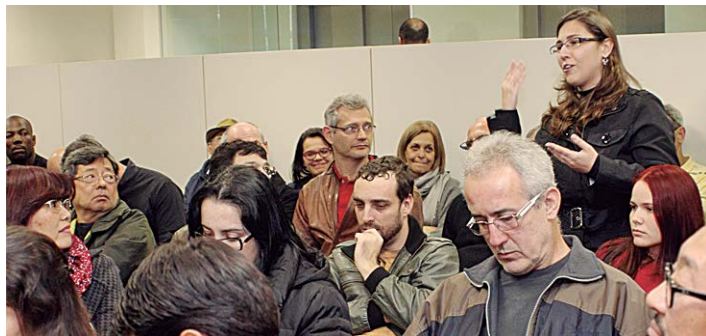
Durante homenagem, servidores falaram da precarização da carreira na Prefeitura da maior cidade do País.