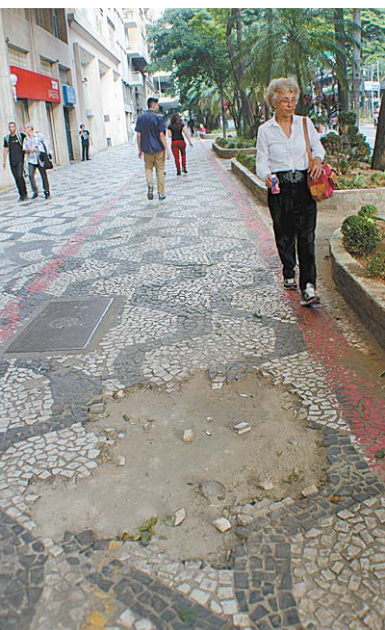
Algumas ciclovias precisam de ajustes, como a da Avenida São Luís, no Centro, que compartilha espaço com pedestres na calçada.