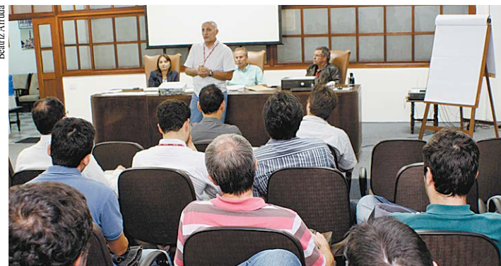
Na CPTM, categoria rejeita proposta econômica apresentada pela empresa e decide por paralisação no dia 3 de junho.

METRÔ – Em assembleia no dia 26 de maio, na sede do SEESP, na Capital, os engenheiros que trabalham no Metrô recusaram a proposta econômica apresentada pela companhia na reunião no Núcleo de Conciliação de Coletivos (NCC) do Tribunal Regional do Trabalho (TRT/SP) no mesmo dia. Decidiram, assim, pela manutenção do estado de greve até a próxima negociação no NCC, agendada para 1º de junho – data em que estava marcada nova assembleia. O SEESP informou ao Metrô que a categoria considerou um avanço a proposta de conciliação colocada pelo Tribunal, especialmente com relação ao cumprimento da Lei nº 4.950-A/66, que trata do piso salarial dos engenheiros.