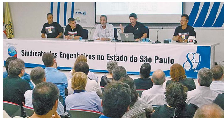
Delegados sindicais do SEESP na Prefeitura de São Paulo apresentam contraproposta durante assembleia.

Em 27 de maio, engenheiros que atuam na Prefeitura Municipal de São Paulo (PMSP) lotaram auditório do SEESP, na Capital, durante Assembleia Geral Extraordinária para debater contraproposta do Executivo Municipal. Trata-se de uma tabela com valores maiores que os anteriormente apresentados, porém, ainda na forma de subsídio, modalidade já rejeitada pela categoria. A tabela equipara os vencimentos iniciais ao piso previsto na Lei 4.950-A/66 para jornada de oito horas diárias.