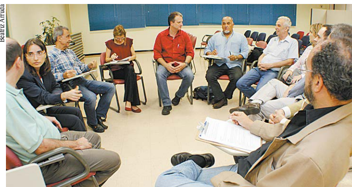
Assembleia dos engenheiros que atuam no Metrô delibera por manutenção de estado de greve.

METRÔ – Em assembleia no dia 26 de maio, na sede do SEESP, na Capital, os engenheiros que trabalham no Metrô recusaram a proposta econômica apresentada pela companhia na reunião no Núcleo de Conciliação de Coletivos (NCC) do Tribunal Regional do Trabalho (TRT/SP) no mesmo dia. Decidiram, assim, pela manutenção do estado de greve até a próxima negociação no NCC, agendada para 1º de junho – data em que estava marcada nova assembleia. O SEESP informou ao Metrô que a categoria considerou um avanço a proposta de conciliação colocada pelo Tribunal, especialmente com relação ao cumprimento da Lei nº 4.950-A/66, que trata do piso salarial dos engenheiros.