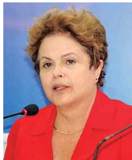
Dilma Rousseff: “Universalização será feita em regime misto, público e privado.”

Um dos pontos defendidos pela campanha é de que a oferta deva também ser feita em regime público para que se concretize uma política de universalização, como ocorreu com a telefonia fixa em décadas passadas. A medida está respaldada no artigo 65 do parágrafo 1º da Lei Geral de Telecomunicações (LGT 9.472/1997), que diz que todo serviço considerado essencial deve ser ofertado de forma universal, não podendo ser co-