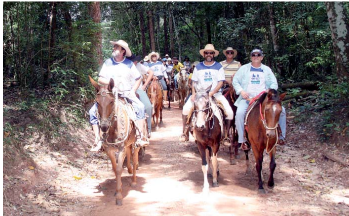
Em sua nona edição, cavalgada reúne cerca de 150 pessoas.

A Delegacia Sindical do SEESP na cidade, em parceria com diversas entidades e empresas, promoveu no dia 20 de março a 9ª Cavalgada das Águas do Rio Canoas, em comemoração ao “Dia Mundial da Água” (22).