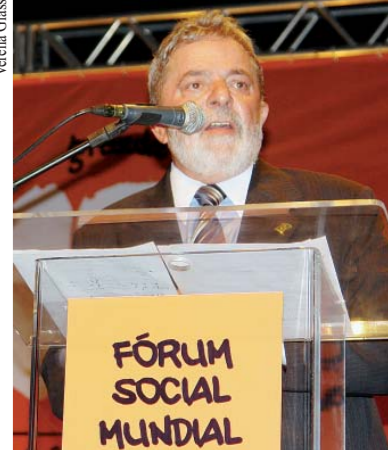
Participação de Lula foi uma das principais atrações do FSM. Presidente pediu solidariedade ao Haiti.

A luta pela redução da jornada de trabalho de 44 para 40 horas semanais esteve presente na tradicional marcha de abertura, que percorreu as ruas de Porto Alegre, com cerca de 30 mil pessoas, na tarde de 25 de janeiro, e teve grande participação do movimento sindical. A necessidade de manter a unidade foi o tema do seminário “Crise global, trabalho decente e pacto mundial pelo emprego”, que reuniu as centrais, no dia 28.