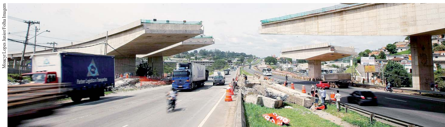
Acidente em trecho do rodoanel sul, em 2009, é exemplo da perda de expertise na engenharia.

Tentar reduzir custos com mão de obra aumenta riscos de ocorrências em construções.