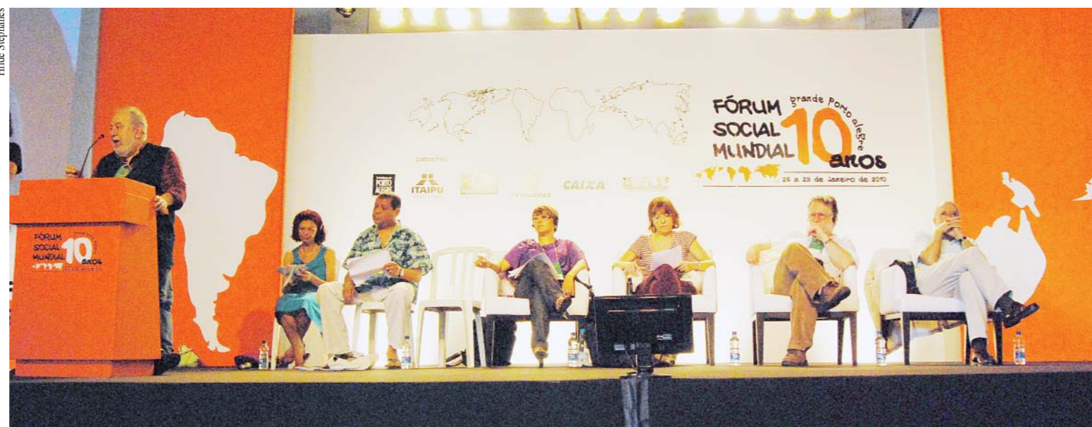
Debate sobre conjuntura social apontou desafios do FSM. Para Emir Sader (na ponta à direita), mera resistência leva à derrota.

Numa edição descentralizada – aconteceram iniciativas em diversas partes do Brasil e do mundo –, o foco principal do encontro foi a reflexão sobre a mobilização que nasceu para se contrapor ao Fórum Econômico Mundial numa época em que grassava a hegemonia neoliberal, seu papel atual, avanços e dificuldades. Esse foi o tema do seminário “Dez anos depois: desafios e propostas para um outro mundo possível”. Nas diversas mesas de discus-