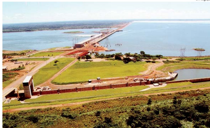
Após o desmonte do setor elétrico, geradora é a bola da vez.

Na ótica dos dirigentes do sindicato, a desestatização é, portanto, insistência no erro. O consultor concorda que esse modelo vai con-