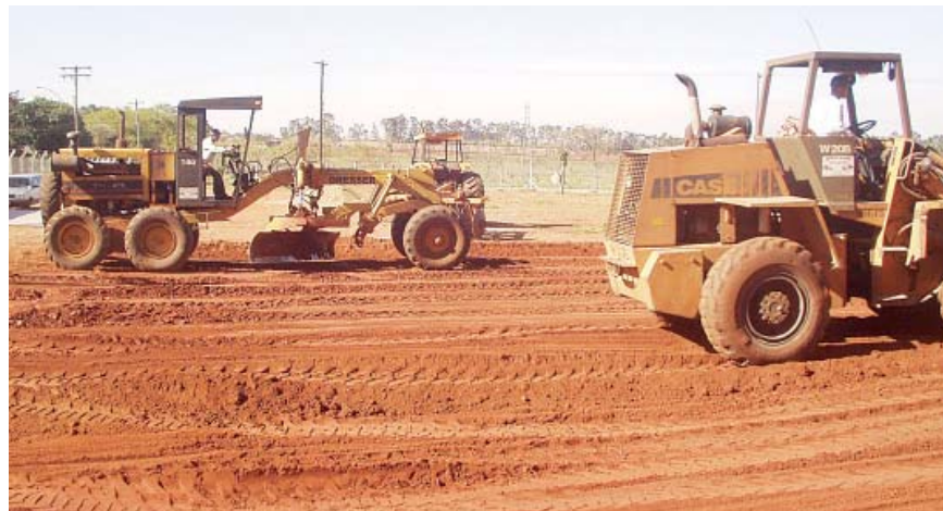
Máquinas trabalham na construção das novas instalações da Moto Brasil conseguidas pelo Proindeb.