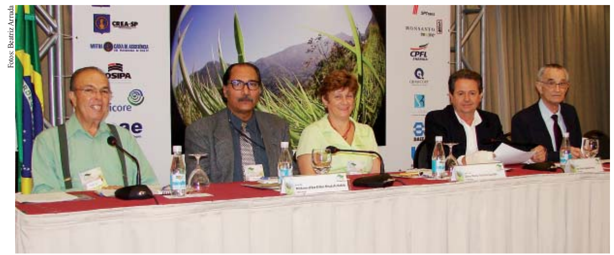
Alimentos geneticamente modificados em debate: perigo ao ambiente e à saúde ou salvação da lavoura?