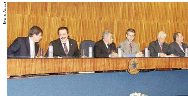
Ato solene em comemoração à data ocorreu na Câmara Municipal de Santo André.