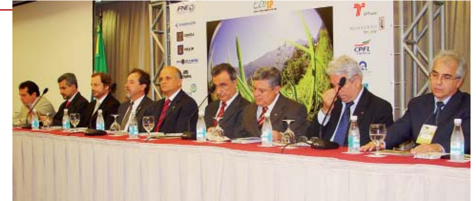
Autoridades ressaltam importância do “Cresce Brasil + Engenharia + Desenvolvimento” e dos profissionais para mitigar impactos sobre a natureza.

essa última fadada a ficar sem o precioso líquido já em 2005, devido ao desperdício. Segundo Agudo, na localidade texana, foi necessário um esforço de gestão para cortar pela metade o gasto médio diário por pessoa de 830 litros – quando o volume considerado adequado mundialmente é de 150 litros. Entre as medidas, instituiu-se a cobrança pelo uso do recurso hídrico, dias de semana alternados para irrigação, além de soluções como reciclagem de esgoto e dessalinização. O Brasil, apesar da condição privilegiada de detentor das maiores reservas de água doce do mundo, para ele, deveria começar a pensar