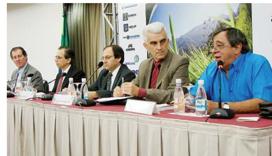
Sustentabilidade não descarta tecnologia, mas exige que se façam opções corretas.

Bom humor Após a maratona de debates, o evento foi encerrado pelo comentarista da rádio