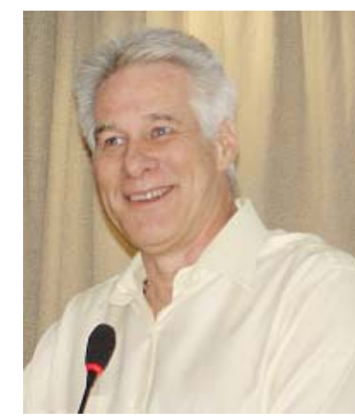
Max Gehringer: é essencial perceber a necessidade de mudanças.

CBN e do Fantástico, na TV Globo, Max Gehringer, que garantiu o toque bem-humorado, com sua palestra “A comédia corporativa”. Entre as observações que arrancaram risos da platéia, um alerta: é fundamental estar atento às mudanças. Ainda conforme Gehringer, a grande transformação ocorrida no mercado de trabalho foi a ascensão feminina, cuja presença em cargos de chefia amplia-se um ponto percentual a cada ano. Nesse ritmo, apontam pesquisas, em 2027, as mulheres serão 52% do total nas gerências. Ele indicou ainda a receita para o sucesso profissional: “ter talento, criatividade e manter-se atualizado.” Nas empresas, é preciso ter visão de futuro e respeito pela experiência.