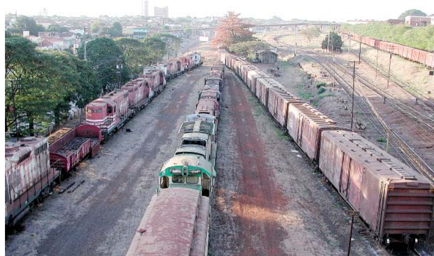
Trilhos que dividem cidade ao meio finalmente serão retirados.