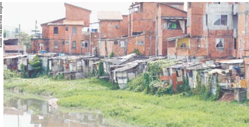
Moradias precárias e falta de saneamento estão entre os desafios a serem enfrentados nas cidades.

Conselho deve ter papel central na solução dos graves problemas urbanos do País.