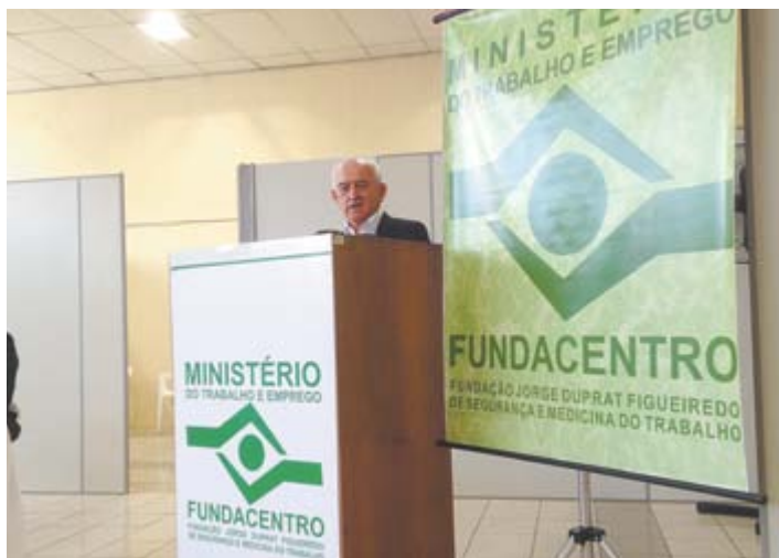
Ministro Manoel Dias prestigia ato solene de instalação do escritório regional da Fundacentro.

Antiga reivindicação dos sindicatos dos trabalhadores da região, o retorno do Escritório de Representação da Baixada Santista da Fundação Jorge Duprat Figueiredo