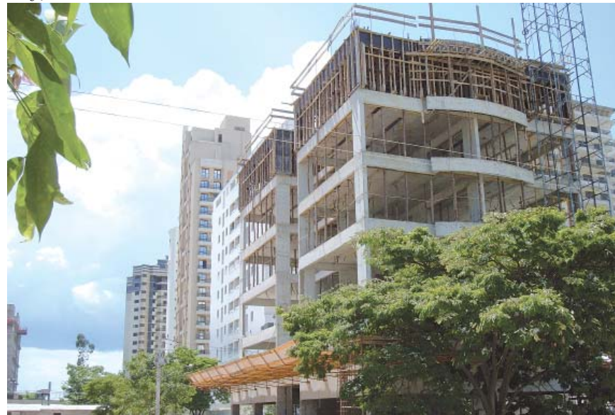
Novas construções e lançamentos no município, no bairro Aquarius.