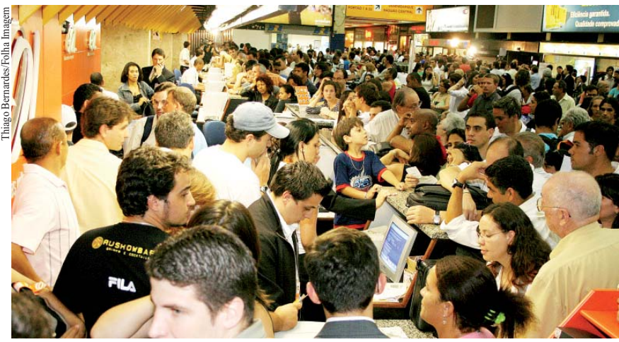
Ampliação do número de vôos para atender demanda concentrou-se principalmente em Congonhas, que operou em 2006 acima de sua capacidade.

De acordo com Alves, o cenário foi agravado por um crescimento espantoso da demanda por transporte aéreo no Brasil de 2004 a 2006, concentrada em São Paulo, particularmente em Congonhas: em média 13% ao ano. Somente entre janeiro e junho último, em número de passageiros transportados, foram mais de 55 milhões de pessoas. O volume de cargas superou os 632 milhões de quilogramas,