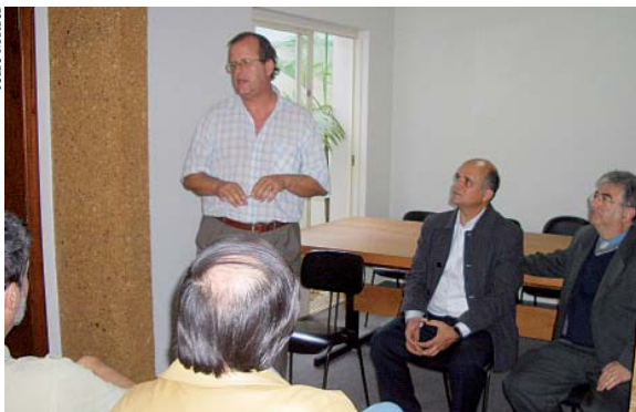
Emprego, qualificação, energia, saneamento, agricultura e soberania alimentar integram temas a serem discutidos em Guará.