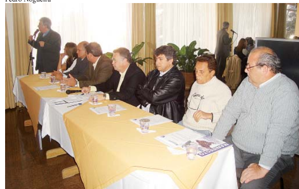
Taubaté deu a largada na instalação de conselhos no início de agosto, em encontro que reuniu cerca de cem pessoas.