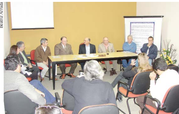
Na cidade de Mogi das Cruzes, anúncio de que delegacia sindical passa a ser do Alto Tietê reforça espírito da iniciativa.